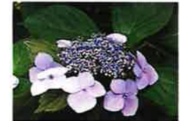
ガクアジサイ(5月下旬) 管理道路/小川沿い