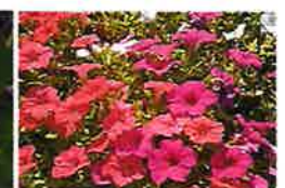
ペチュニア(6月) シンボルマーク