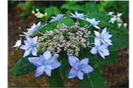
シチダンカ(6月下旬) 管理道路