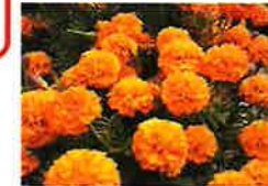
マリーゴールド(6月) 四季彩の丘