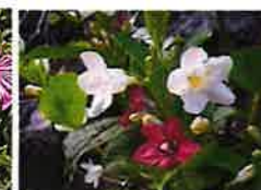
ハコネウツギ(6月上旬) 外周囲路