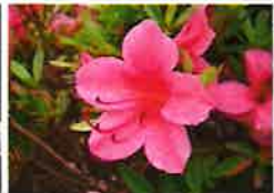
サツキツツジ(6月上旬) 第1P