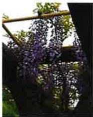
フジ(6月上旬) 団地間道路入口/出口