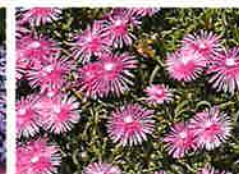
マツバギク(6月) シンボル桜法面