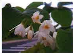
ハクウンボク(6月) 第一P