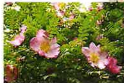
サンショウバラ(6月上旬~) 桜の散歩道入口