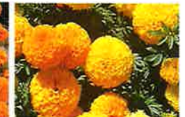
マリーゴールド(6月) ディスカバリー種 ヘリコプター横