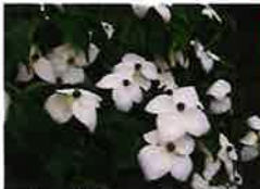
ヤマボウシ(6月上旬) さくらの散歩道