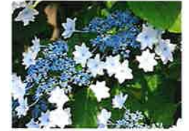
墨田の花火(6月下旬) 管理道路