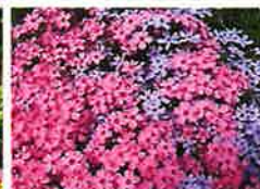
シバザクラ(6月) ふれあい広場法面