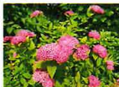
ハクウンボク(6月) 第一P